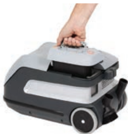
Enkel tilgang til batteriet gjør det enkelt og greit å lade og skifte batteri