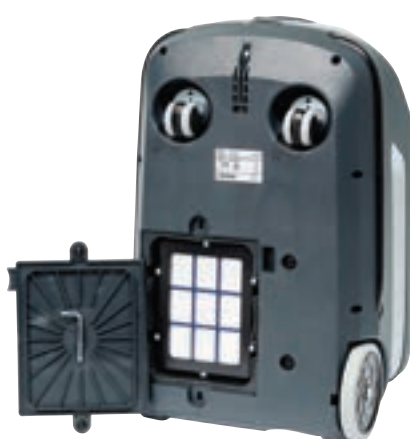
HEPA H13-filteret er standard på alle VP600 modeller