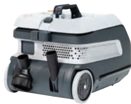
Brukervennlig tilbehør som det er enkelt å komme til