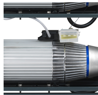
Pumpens oljetank har nivåglass.