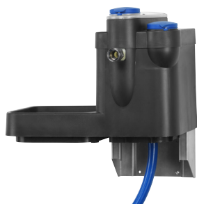
Ekstern vanntank med en kapasitet på opptil 40 liter/minutt.