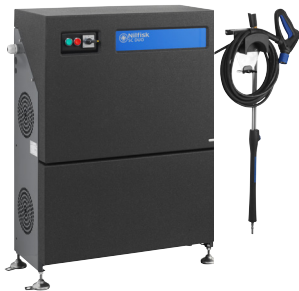
Oppbevaring av tilbehør.